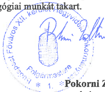
* Pokorni Zoltán polgármester

Budapest Hegyvidék, 2014. augusztus „...”